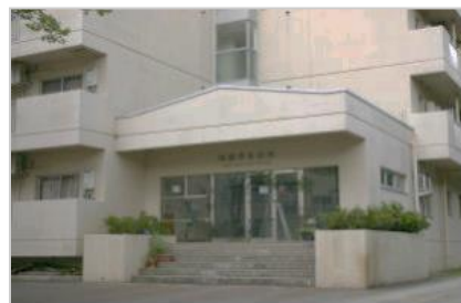
[ 国際学生宿舎 外観 ]

夫婦室（9,500円/月・共益費1,500円/月） キッチン、ユニットバス、トイレ、給湯設備、冷暖房用空調設備、シングルベット2、片袖机、回転椅子、書棚、応接テーブル、応接イス、食卓テーブル、食卓イス、食器棚、整理ダンス、玄関収納庫、洗濯機、乾燥機、冷蔵庫、電気スタンド、クローク