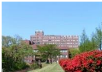
[正面から見た上越教育大学]