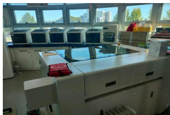
(写真右：PCルーム、左：3Dプリンター)