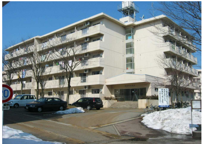
国際学生宿舎 International House